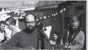
バックヤード Backyard 監督: アルニス・スヴェインソン (Arni Sveinsson)

近年、ユニークな才能を続々輩出するアイスランド音楽シーン。レイキャピクの民家の裏庭をステージに、彼ら一流アーティスト達がライブを開催。その準備からFMベルファスタやムームらのパフォーマンズ、打ち上げまで、完全密着で捉えた音楽ドキュメンタリー、ファン必見の一作。