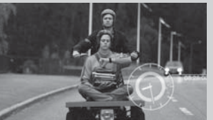
シンプル・シモン I nymden finns inga känslor / Simple Simon 監督: アンドレアス・エーマン (Andreas Öman)

『シンプル・シモン』『ラップランド・オデッセイ』とコメディ2作品、アート系ドキュメンタリーやちょっと変わった古典作品など、バラエティに富んだラインナップを揃えました。