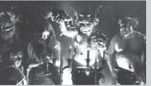
魔女 Häxan / Witchcraft Through the Ages 監督: ベンヤミン・クリステンセン (Benjamin Christensen)

メイクや撮影に数々の特殊技術を駆使し、中世魔女伝説の世界を再現ドラマ化した独創性あふれるサイレント作。当時はその内容が問題視され、多くの国で公開禁止となった。後年作品の驚くべきクオリティが絶賛、ホラーの聖典とも称される。今回、最新修復版のスクリーン上映が実現。