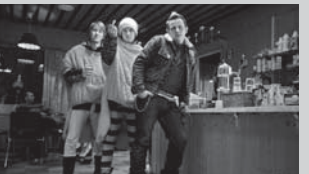
ラップランド・オデッセイ Napapiirin sankarit / Lapland Odyssey 監督: ドム・カルコスキ (Dome Karukoski)

フィンランド映画のイメージを覆す、コミカルなロードムービー。大事な金を使い込み恋人に追い出された無頼の男が、仲間と共に彼女の信頼を取り戻すための旅に出る…。真冬のラップランドを舞台に、トラップ続きの旅を通じて成長する男たちの姿を描く、2010年最大のヒット作。