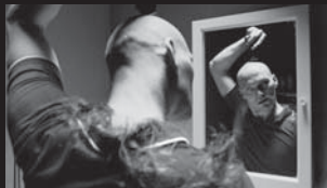
エンジェル・オブ・ザ・ユニバース Englar alheimsins / Angels of the Universe

画家志望の青年ポールは失恋の痛手から精神が不安定に。入院先の精神病院で、あまりにも個性的な新しい仲間たちに出会う。シガー・ロスははじめ、時代と国境を超えた名曲の数々に彩られたフリドリクソン劇場未公開作。アイスランドの映画と音楽を変するファン待望の上映決定!