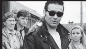
精霊の島 Djöflæjyan / Devil's Island

1991年 / アイスランド他 / アイスランド語 / 82min ©1991年アカデミー賞外国語映画賞ノミネート