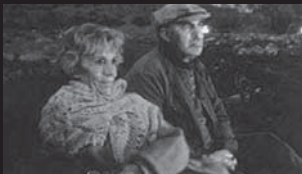
春にして君を想う Börn náttúrunnar / Children of Nature

Profile アイスランドを代表する映画監督・プロデューサー。1953年レイキャピク生まれ。大の映画好きだった母親の影響を受け、10代の頃から16ミリで短編映画を撮り始める。アイスランド大学在学中に映画クラブを創設。またアイスランド初の映画雑誌を創刊し、批評も手がける。78年にはレイキャピク映画祭の立ち上げに関わり、実行委員長も務めた。87年に『White Whales』で長編デビュー。同じ年、アイスランドティック・フィルム・コーポレーションを設立。自作の製作と並行して、多くのアイスランド映画をプロデュースし、世界中にアイスランド映画ファンを増やした立役者となった。