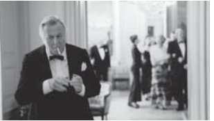
セレブレーション Festen / The Celebration

「ドグラ95」の記念すべき第一作。選考を迎えた富豪を祝うため、親族や友人らが郊外の豪邸に集う。やがて上流階級一家の秘密が、息子の口から暴露されてゆく…。ドグラ効果が生み出す臨場感と緊迫感で、人間の本性が抉り出される様を、まざまざと見せつけられる衝撃の映画体験。