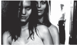
ネクスト・ドア/隣人 Naboer/Next Door 監督: ポール・シユレットアウネ (Pål Sletaune)

恋人と別れ傷心に沈む男の日常がある日出逢った轟動的な隣人姉妹によって狂わされてゆく…。長編デビュー作『ジャンク・メール』で世界中の喝采を浴び、ノミ・リバス主演の最新作『Baby Call』(2011)も各国で注目される、シユレットアウネの衝撃のサイコ・スリラー。