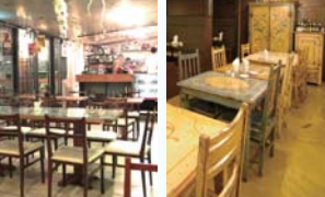
カフェテオ カフェレストラン タペラ

カフェやレストランで食事やお茶を楽しみながら、北欧映画の余韻にひたしませんか。ユーロスペース1Fの「Cafe Theo(テオ)」、アップリンク1Fの「カフェレストランTabela(タペラ)」をぜひご利用ください。お店の詳細情報は、WEBサイトにて。 【*フィーカ = スウェーデン語でお茶とともに過ごす楽しい時間のこと】